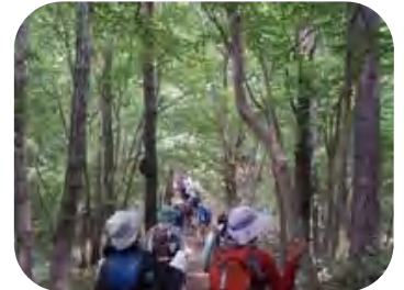
クヌギやコナラ林