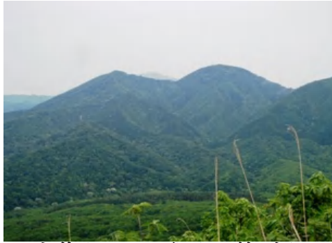
上蒜山より二俣山・皆ガ山