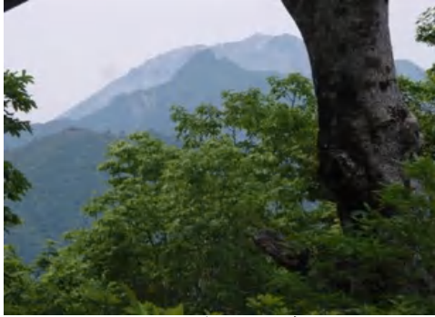
皆ガ山より大山・烏ガ山