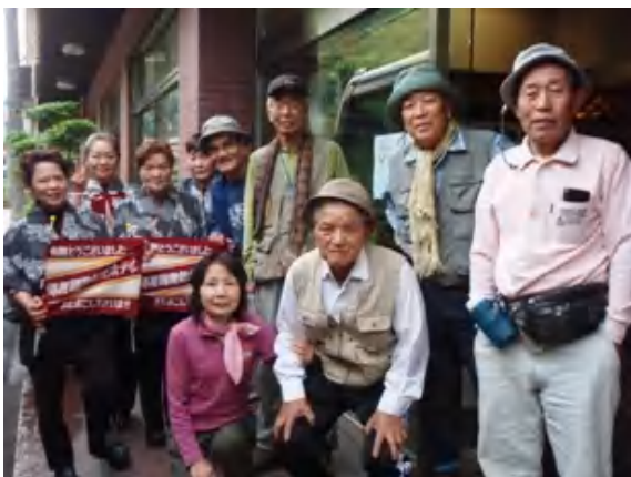
ホテルの皆様お世話になりました