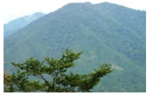
皆ガ山より上蒜山